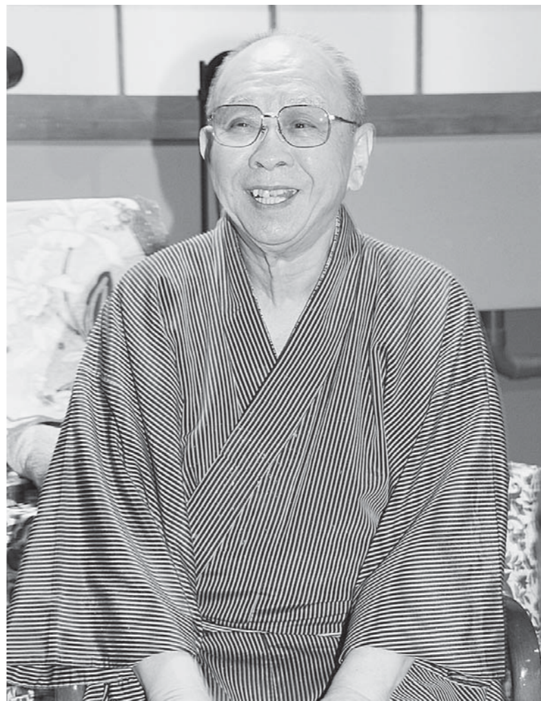
法然聖人役 中村梅之助 さん

実は法然さんを演じるのは今回で二回目。一九八二年の法然聖人ご誕生八百五十年の時に法然さんを演じました。あの時は、浄土真宗のご門徒さんも見に来てくださっていました。なぜそれがわかるかと言えば、法然聖人と親鸞聖人が初めて出会う場面があるんですが、その時に客席の一角からなんとお賽銭が飛んできたんですよ(笑)。