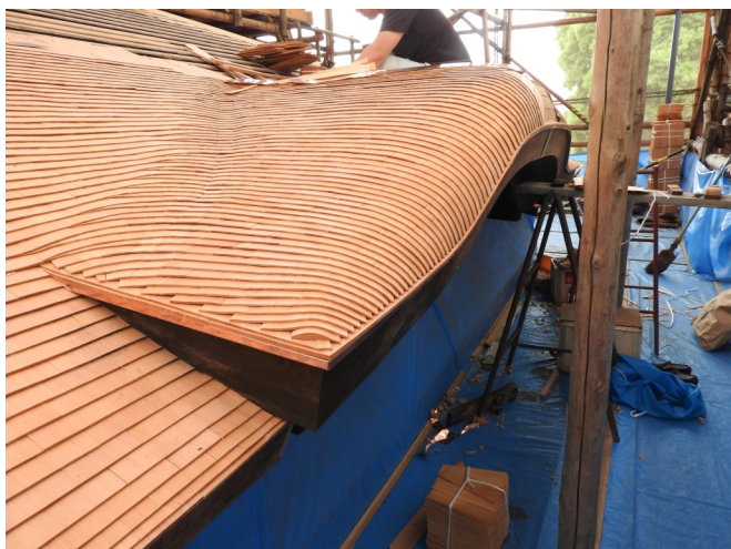
▲ 2層目の唐破風(中央が膨らんだ形の部分)