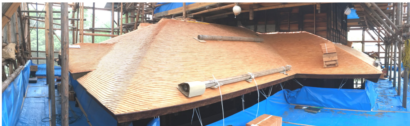
▲ 2層目現況 葺き込んだ銅板はこけら板に隠れて見えなくなる