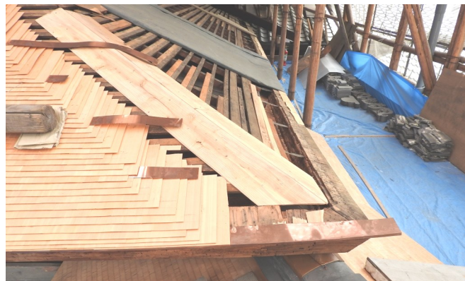
▲ 葺き込まれた銅板