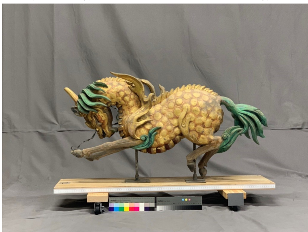
▲ クリーニング後、彩色調査中の麒麟(きりん)