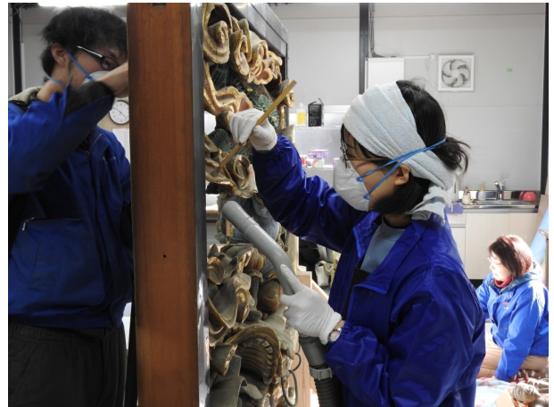
▲ 彫刻をクリーニングする様子