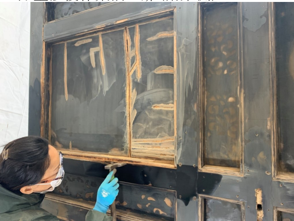
▲ 傷んだ箇所を慎重に掻き落としていく