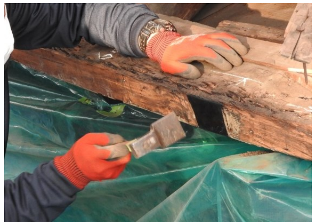
▲ 「叩きのみ」という道具で漆を掻き落とす