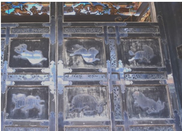
▲ 漆塗修復作業前の扉(南東側)

修復では、まず、紫外線や風雨で劣化が進み光沢が失われた漆や、亀裂が入り傷んだ箇所を掻き落とし、下地の調整を行います。この下地の段階で塗面を凹凸なく平らに仕上げることが重要で、少しでも下地に歪みがあると、漆を塗った際に表面が美しく仕上がりにません。そのため、銚金具などを止めていた釘穴には細い棒で埋木を施し、亀裂のあった箇所は、「刻苧」と呼ばれる漆に木くずや綿を混ぜたパテを埋め、場所によっては布をあてたりして、何度も調整を行い、下地を平面に仕上げていきます。