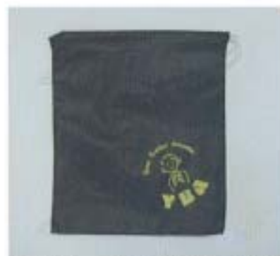
ゆったりナップサック。350円(300)