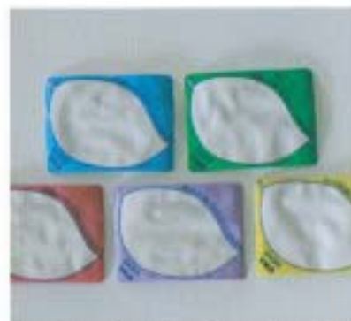
カラフルなビニール名札。60円(50)