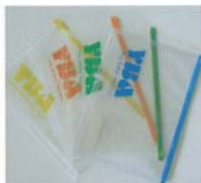
色で分類、クリアケース。400円(350)