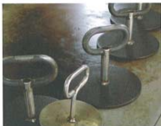
キャベツを蒸し焼きにするオモシ。

どんなメニューがあるのか聞いてみた。すると「メニューはあるけどお客さんが食べたいものを入れるよ」と、笑顔で答えてくれた。