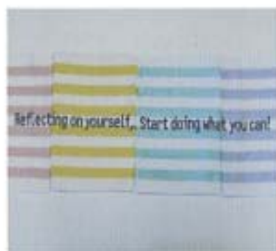
番外と丈夫なタオル。400円(350)